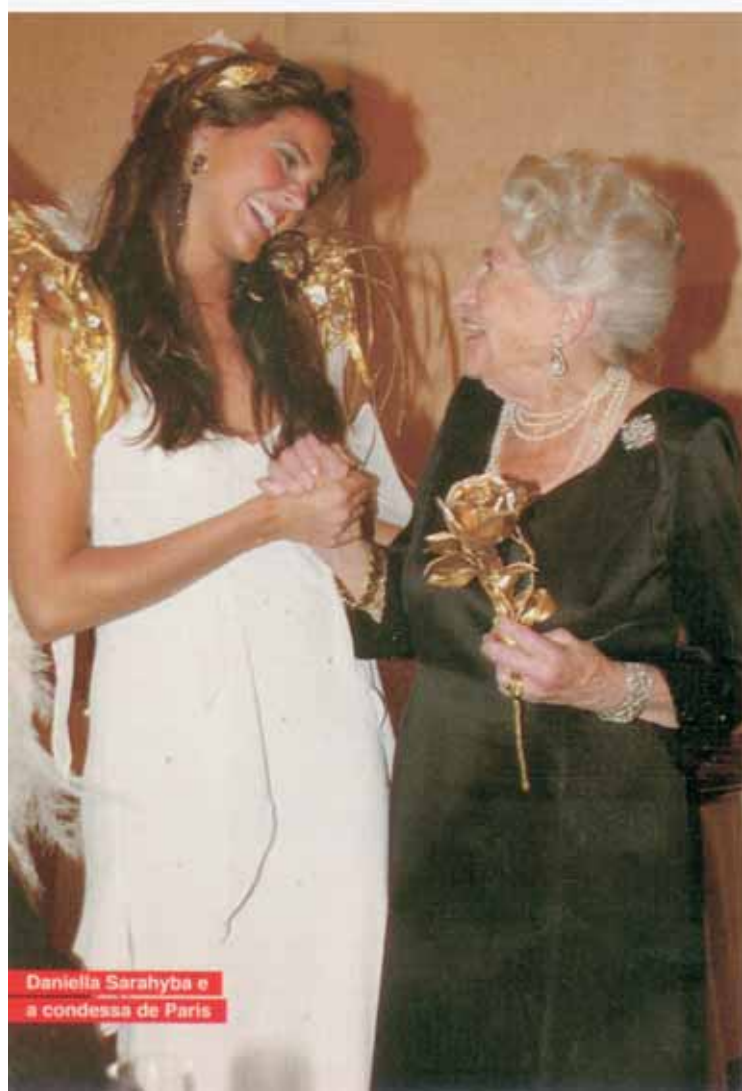
Daniella Sarahyba e a condessa de Paris

Na noite de luxo, Daniella entrega uma rosa de ouro à condessa de Paris, numa referência à homenagem de escravos à sua avó, a princesa Isabel.